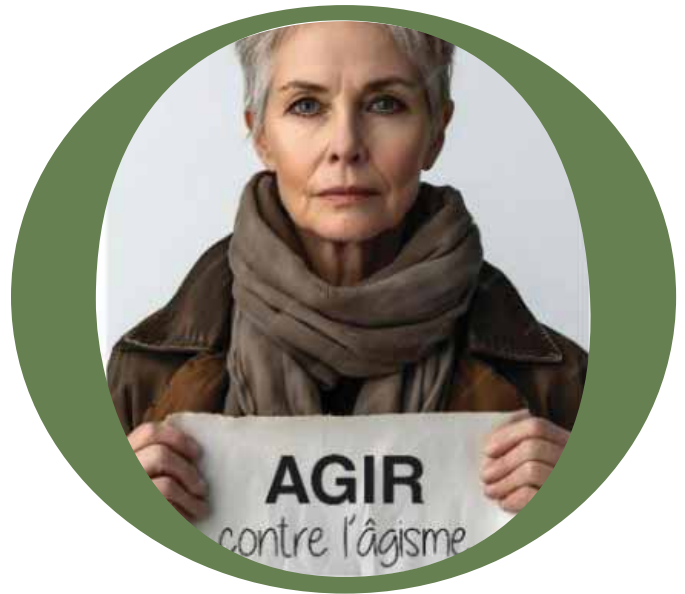
Nouveaux visuels suggérés pour notre document Proposition d'atelier (2025-2026)

Nous transmettons par les données suivantes le rapport faisant état des résultats atteints du 1 er avril 2024 au 31 mars de l'année 2025. En dépit des événements imprévisibles, survenus il y a quelques années, nous adaptons toujours non seulement notre discours mais aussi nos façons de faire. De fait, et selon les demandes, la très grande majorité de nos ateliers s'effectue avec la présence d'un animateur avec les différents groupes et certains, dans des cas particuliers qui l'exigent,