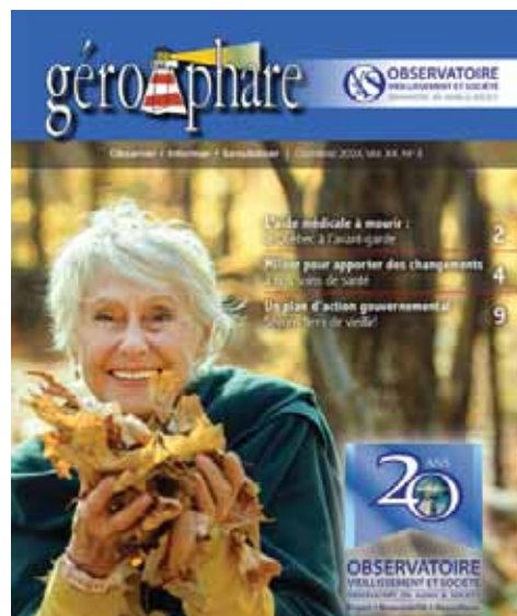
NUMÉRO : AUTOMNE 2024

Nous avons élargi la variété des sources, des textes et des présentations non spécifiquement liés à des contenus thématiques mais généraux et ouverts afin d'intéresser davantage les lecteurs. Ils contiennent aussi parfois un encart central qui propose des aspects pratiques et intéressants pour les aînés.